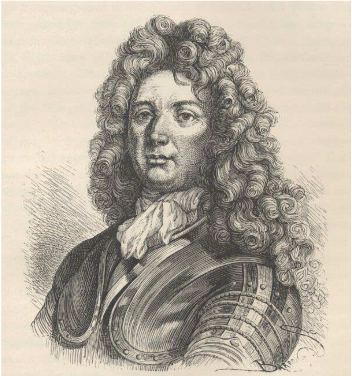
Sébastien LE PRESTRE, Marquis De Vauban, Maréchal de France